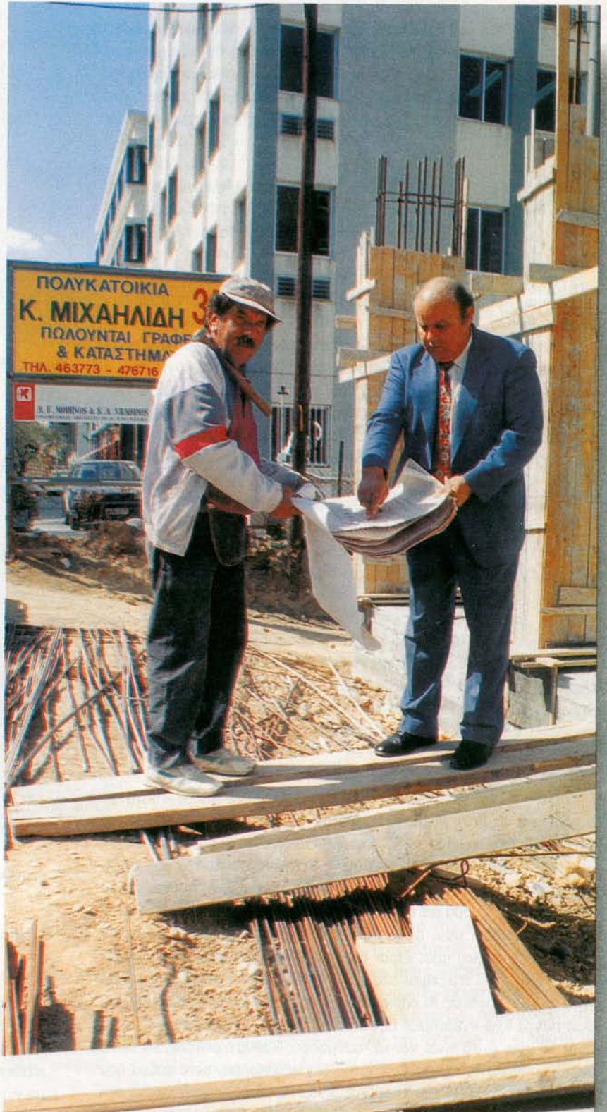
Πρώι-πρώι στην οικοδομή. Εδώ δίνει εντολές στον εργοδηγό του, για τις εργασίες της 35ης πολυκατοικίας, σε πάροδο της Λεωφόρου Στασίνου.